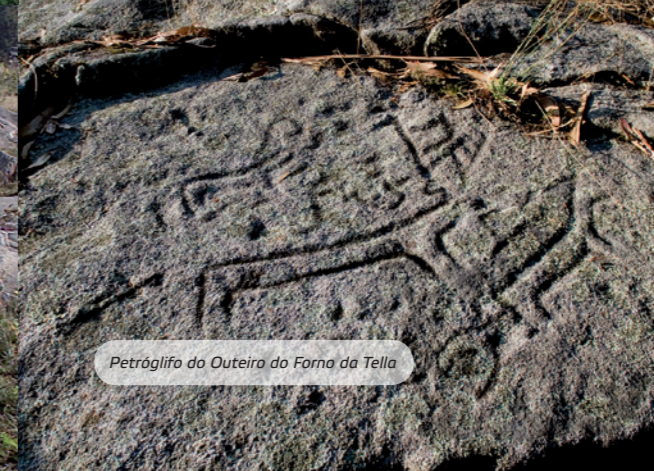
Petróglifo do Outeiro do Forno da Tella