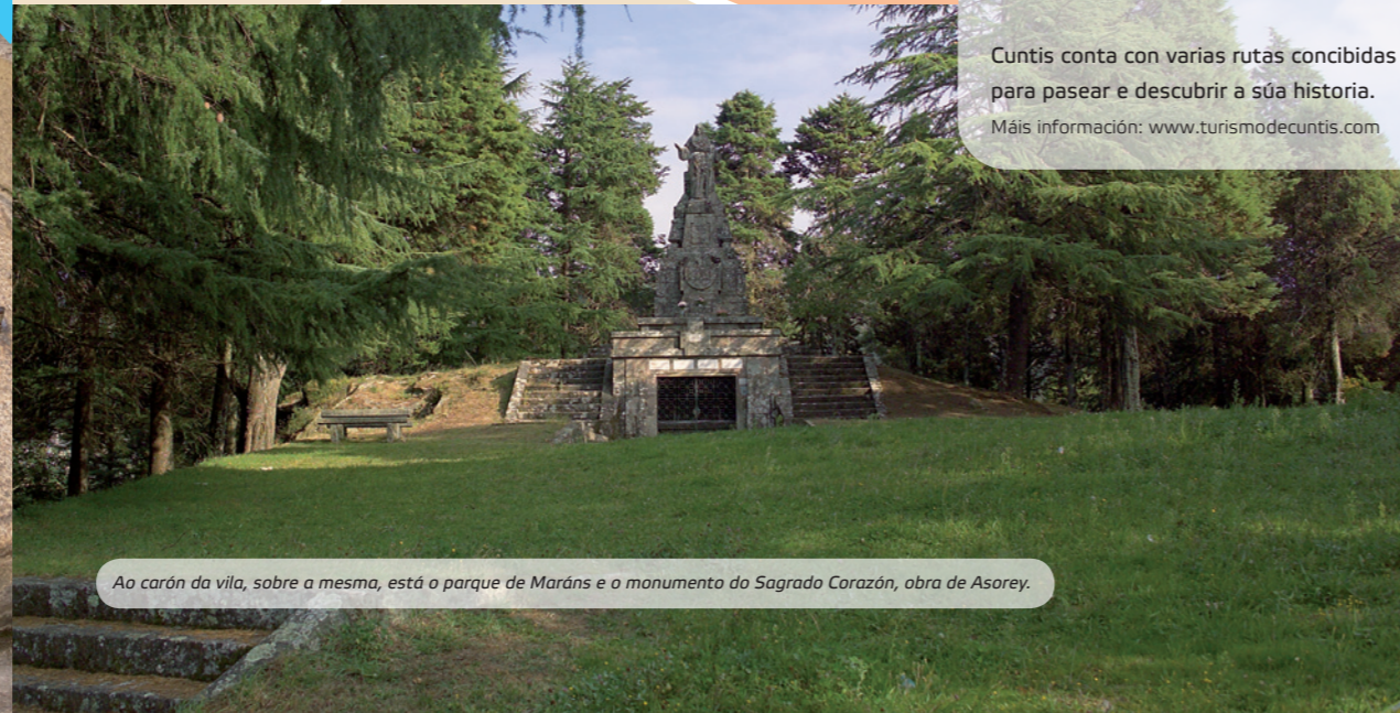
Ao carón da vila, sobre a mesma, está o parque de Maráns e o monumento do Sagrado Corazón, obra de Asorey.

Cuntis conta con varias rutas concibidas para pasear e descubrir a súa historia. Máis información: www.turismodecuntis.com